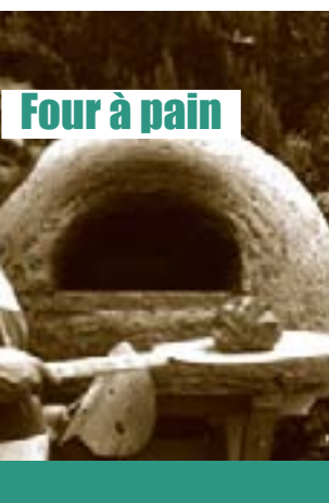
Four à pain