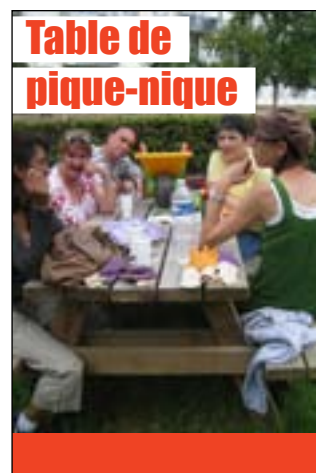
Table de pique-nique